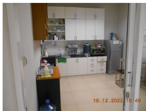
รูปที่ 12 ห้องพักพนักงาน

ภาพถ่ายประกอบผลการปฏิบัติตามมาตรการป้องกันและแก้ไขผลกระทบสิ่งแวดล้อม