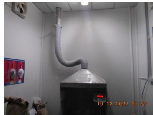
รูปที่ 32 พัดลมดูด AH Salt ออกนอกอาคารผลิต