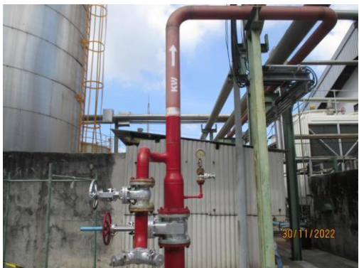
รูปที่ 25 ระบบท่อส่งน้ำดับเพลิง