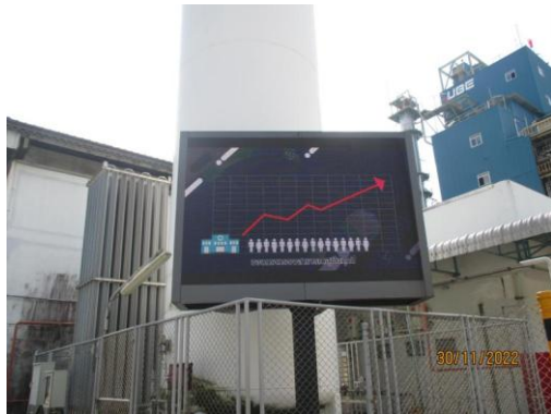
รูปที่ 35 ช่องทางการสื่อสารด้านความปลอดภัย