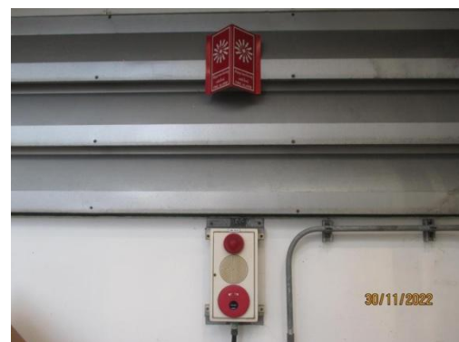
รูปที่ 28 Manual Call Point

ภาพถ่ายประกอบผลการปฏิบัติตามมาตรการป้องกันและแก้ไขผลกระทบสิ่งแวดล้อม