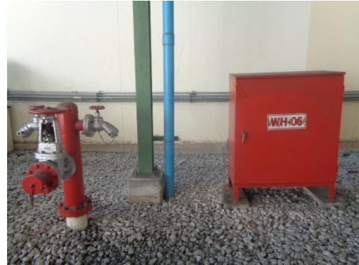
รูปที่ 24 Hose Box และหัวจ่ายน้ำดับเพลิง