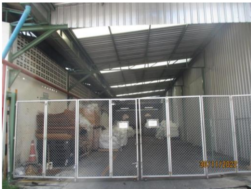
รูปที่ 15 อาคารเก็บกากของเสียรอการจัด