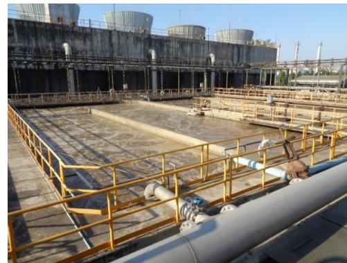
รูปที่ 8 ระบบบำบัดน้ำเสียของ โรงงานผลิตสารคาโปแลคตัม