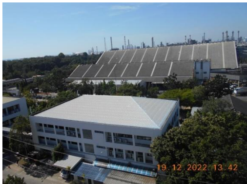
รูปที่ 39 รูปแบบอาคารสิ่งก่อสร้าง ที่ไม่ทำลายทัศนียภาพและสิ่งแวดล้อม