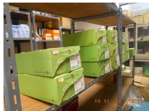
รูปที่ 34 อุปกรณ์คุ้มครองความปลอดภัยส่วนบุคคล

ภาพถ่ายประกอบผลการปฏิบัติตามมาตรการป้องกันและแก้ไขผลกระทบสิ่งแวดล้อม