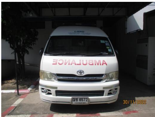
รูปที่ 31 รถพยาบาล