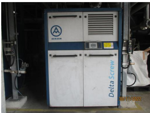
รูปที่ 9 อุปกรณ์ลดระดับเสียงที่แหล่งกำเนิด