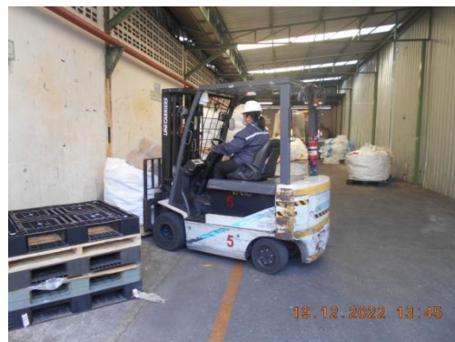
รูปที่ 17 พนักงานควบคุมและดูแลการจัดเก็บและเคลื่อนย้ายของเสีย

ภาพถ่ายประกอบผลการปฏิบัติตามมาตรการป้องกันและแก้ไขผลกระทบสิ่งแวดล้อม