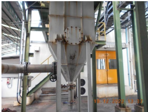
รูปที่ 3 Bag Filter ในระบบบำบัดแก๊สไนล่อน