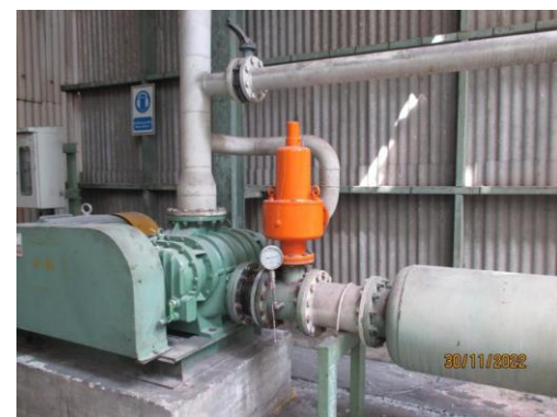
รูปที่ 37 Interlocking Valve และ Safety Relief Valve