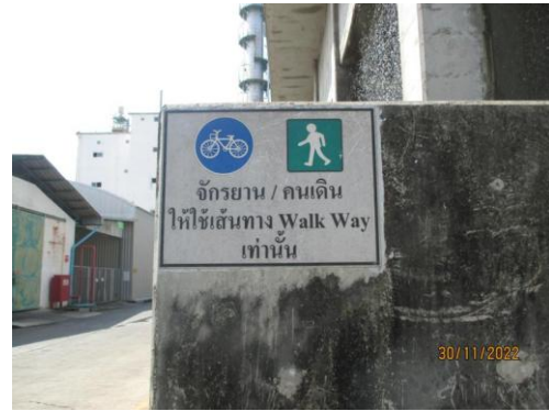
รูปที่ 18 ป้ายจราจรและป้ายจำกัดความเร็วภายในโรงงาน