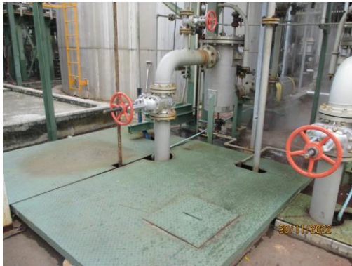
รูปที่ 7 บ่อตรวจสอบคุณภาพน้ำเสียของโรงงาน