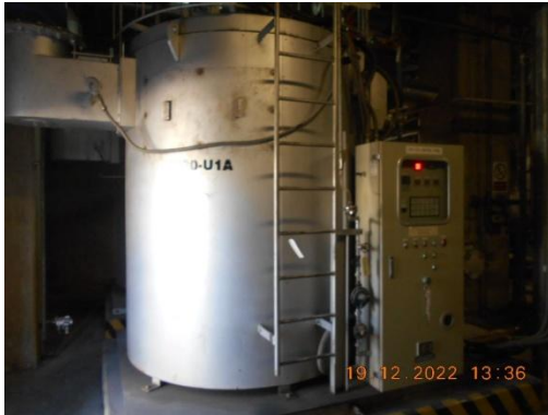
รูปที่ 1 Hot Oil Heater