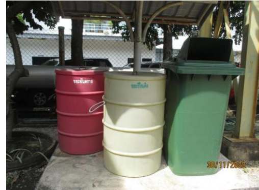
รูปที่ 14 ถังขยะแยกประเภทที่มีฝาปิดมิดชิด