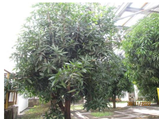
รูปที่ 38 พื้นที่สีเขียวภายในโรงงาน

ภาพถ่ายประกอบผลการปฏิบัติตามมาตรการป้องกันและแก้ไขผลกระทบสิ่งแวดล้อม