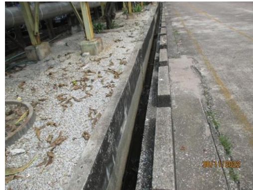
รูปที่ 4 รางระบายน้ำฝน