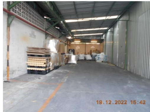
รูปที่ 16 การแบ่งพื้นที่ระหว่างมูลฝอย และสิ่งปฏิกูลหรือวัสดุที่ไม่ใช่แล้ว