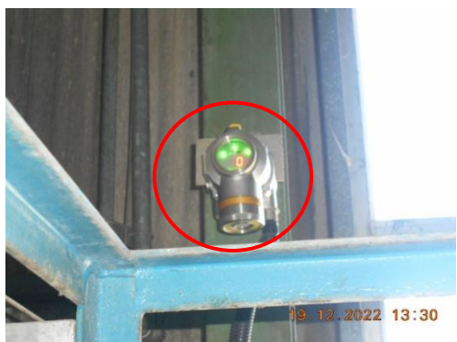
รูปที่ 27 Flammable Gas Detector