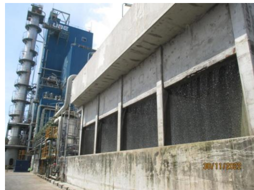
รูปที่ 6 Cooling Tower

ภาพถ่ายประกอบผลการปฏิบัติตามมาตรการป้องกันและแก้ไขผลกระทบสิ่งแวดล้อม