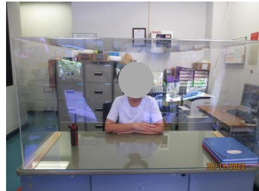
รูปที่ 30 พยาบาลประจำห้องพยาบาล