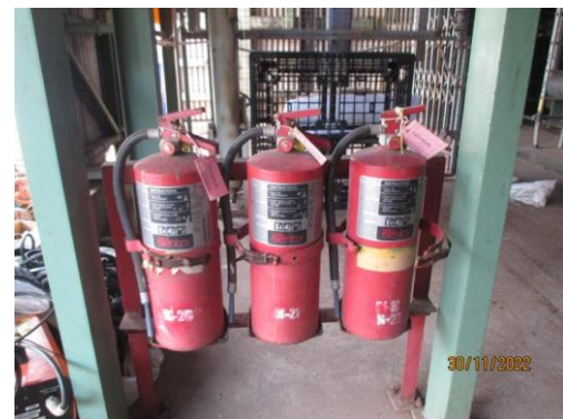
รูปที่ 26 ถังดับเพลิง