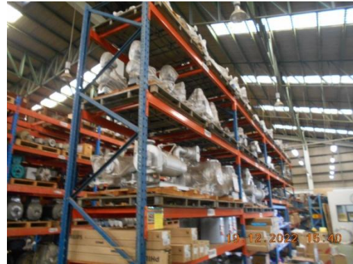
รูปที่ 2 ะโหล่สำรอง อุปกรณ์ซ่อมบำรุง สำหรับบำบัดมลพิษทางอากาศ