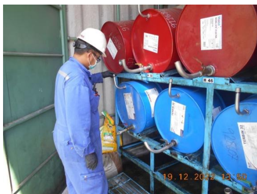
รูปที่ 33 พนักงานสวมใส่อุปกรณ์คุ้มครองความปลอดภัยส่วนบุคคลขณะเติมสารเคมี