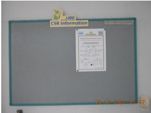
รูปที่ 13 บอร์ดประชาสัมพันธ์ และช่องทาง การสื่อสารด้านความปลอดภัย