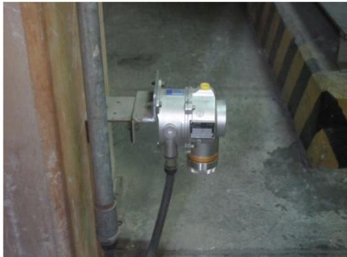
รูปที่ 23 Gas Detector