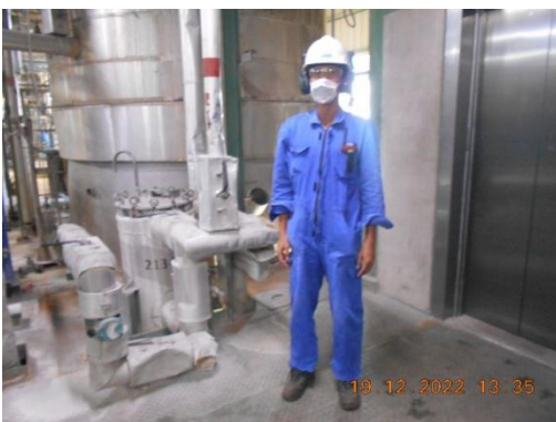
รูปที่ 11 พนักงานสวมใส่อุปกรณ์ป้องกันเสียง