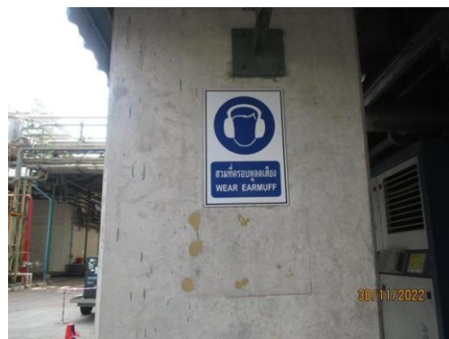
รูปที่ 10 ป้ายเตือนให้สวมใส่อุปกรณ์ป้องกันเสียง