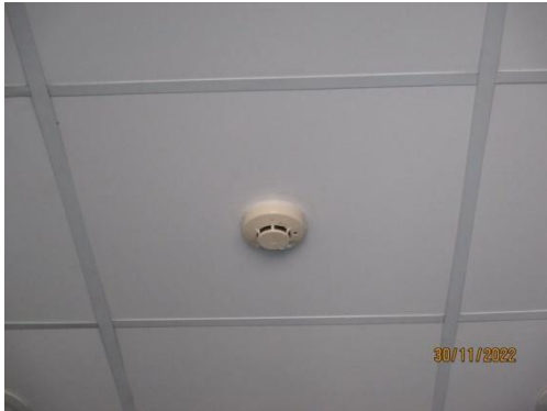
รูปที่ 29 Smoke Detector