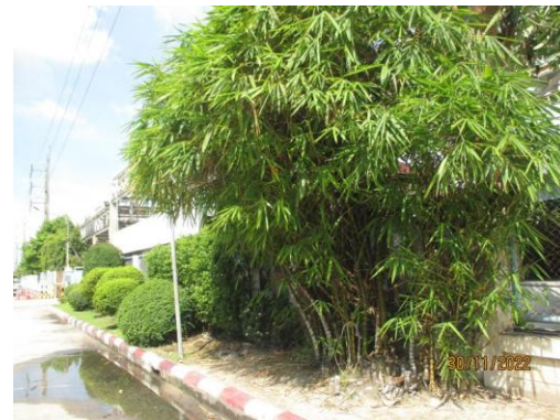
รูปที่ 38 พื้นที่สีเขียวภายในโรงงาน (ต่อ)